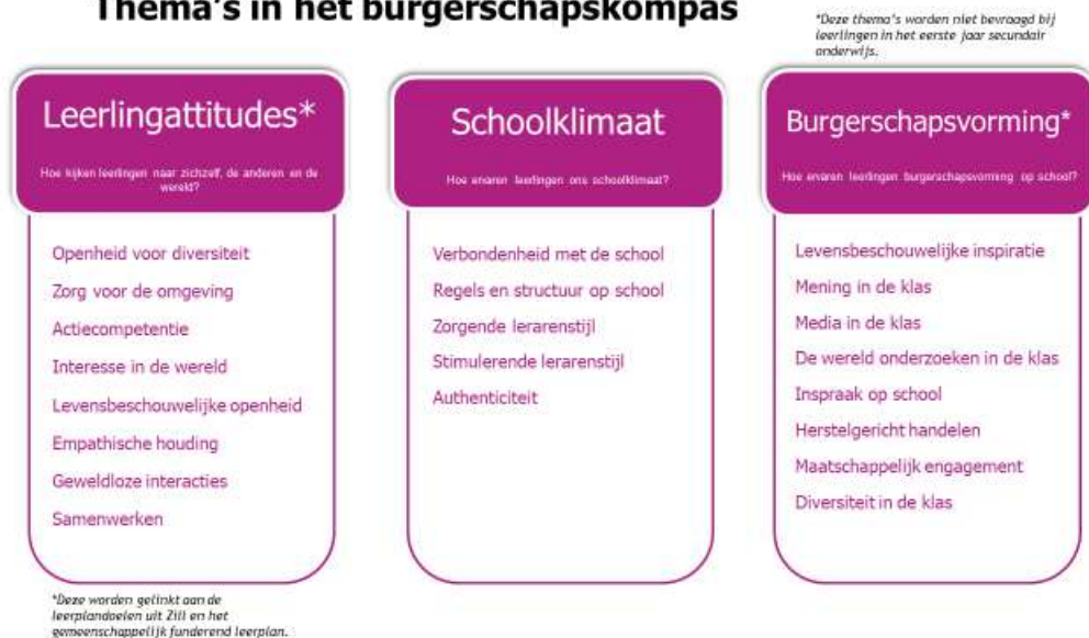
Figuur 2. Inhoud van de thema's in het burgerschapskompas

De schalen die gebruikt werden om de pijlers te operationaliseren zijn vaak geïnspireerd op wetenschappelijke gevalideerde bronnen. In Tabel 3 presenteren we een overzicht van de bevroegde concepten en de link met reeds bestaande bronnen. Op basis van fase I van het pilootonderzoek werden aanpassingen aangebracht in de formulering van sommige items en werden soms keuzes gemaakt m.b.t. welke stellingen werden opgenomen en welke niet. Omdat het aantal aanpassingen aanzienlijk is, spreken we dan ook over 'geïnspireerd op' een reeds bestaande gevalideerde schaal. In het beschrijvend onderzoek verderop in dit rapport, presenteren we in hoeverre onze operationalisering betrouwbaar zijn.