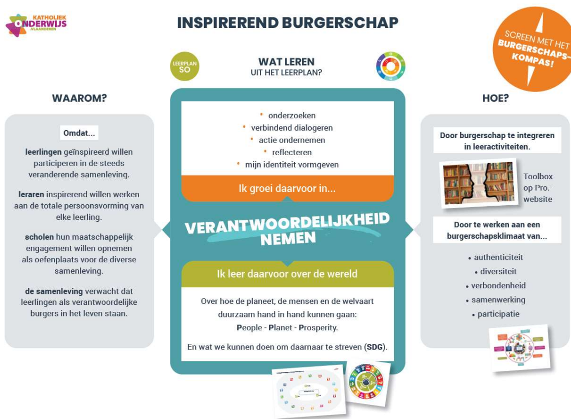
Figuur 1. Inspirerend burgerschap in een notendop

We geloven dat inspirerend burgerschap in een katholieke dialoogschool een plaats heeft omdat leerlingen geïnspireerd willen participeren in een veranderlijke maatschappij, omdat leraren inspirerend willen bijdragen aan de persoonsvorming van leerlingen, omdat scholen hun maatschappelijk engagement willen en kunnen opnemen en omdat de samenleving verwacht dat leerlingen als verantwoordelijke burgers hun plaats in de samenleving opnemen. Om die verantwoordelijkheid te kunnen en willen opnemen, dienen leerlingen te groeien in het vormgeven van hun identiteit, reflectie, actie ondernemen, verbindend dialogeren en kritisch onderzoek. Leerlingen worden ondersteund in dit groeiproces door burgerschap te integreren in leeractiviteiten op school en door in te zetten op het ontwikkelen van een burgerschapsklimaat op school. Dergelijk klimaat ontstaat door in te zetten op authenticiteit, diversiteit, verbondenheid, samenwerking en participatie op school.