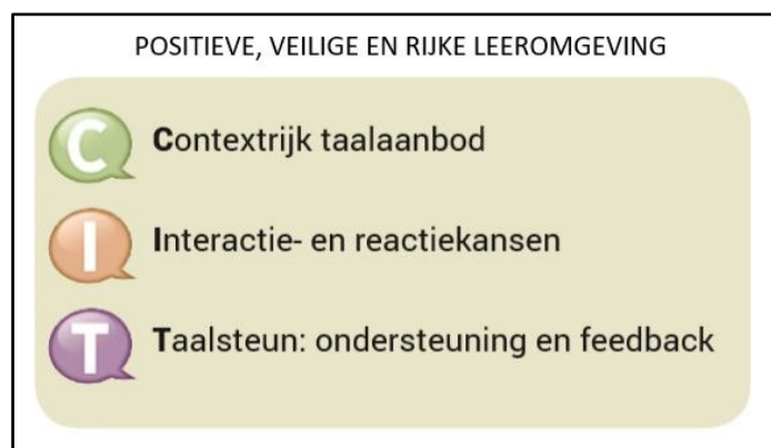
Figuur 1: Taalgericht onderwijs

Taalgericht lesgeven kun je toepassen bij elke activiteit waarbij de focus niet (alleen) ligt op talige doelen. Je combineert daarbij vaak verschillende elementen uit de drie pijlers.