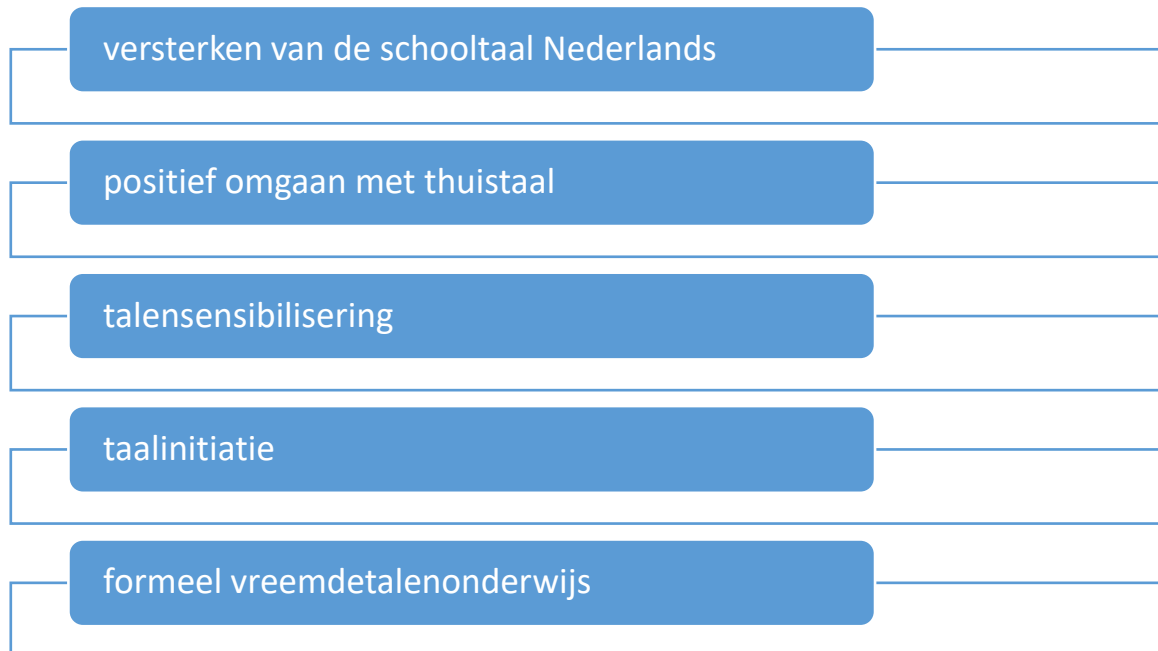
Figuur 3: Omgaan met meertaligheid

Leerlingen die thuis een andere taal spreken dan het Nederlands, hebben op school veel nood aan stimulering en ondersteuning bij de verwerving van het Nederlands. Het is voor hen van groot belang dat ze in het Nederlands schools taalvaardig worden. Een goede ontwikkeling van de thuistaal en een positieve benadering van meertaligheid zijn daarbij belangrijk als basis om de taalvaardigheid Nederlands op te bouwen.