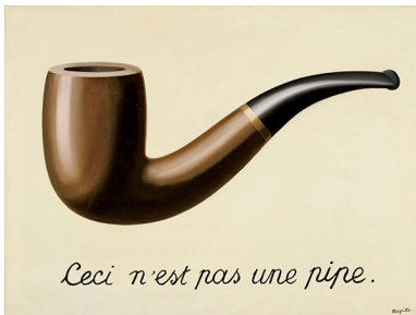
René Magritte - La Trahison des images

Opdracht: Kies samen met een klasgenoot een kunstwerk van onderstaande kunstenaars. Vul de analysevragen in. Duid een schilderij aan en beantwoord de vragen.