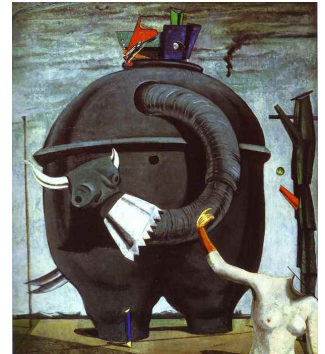
Max Ernst - The Elephant Celebes