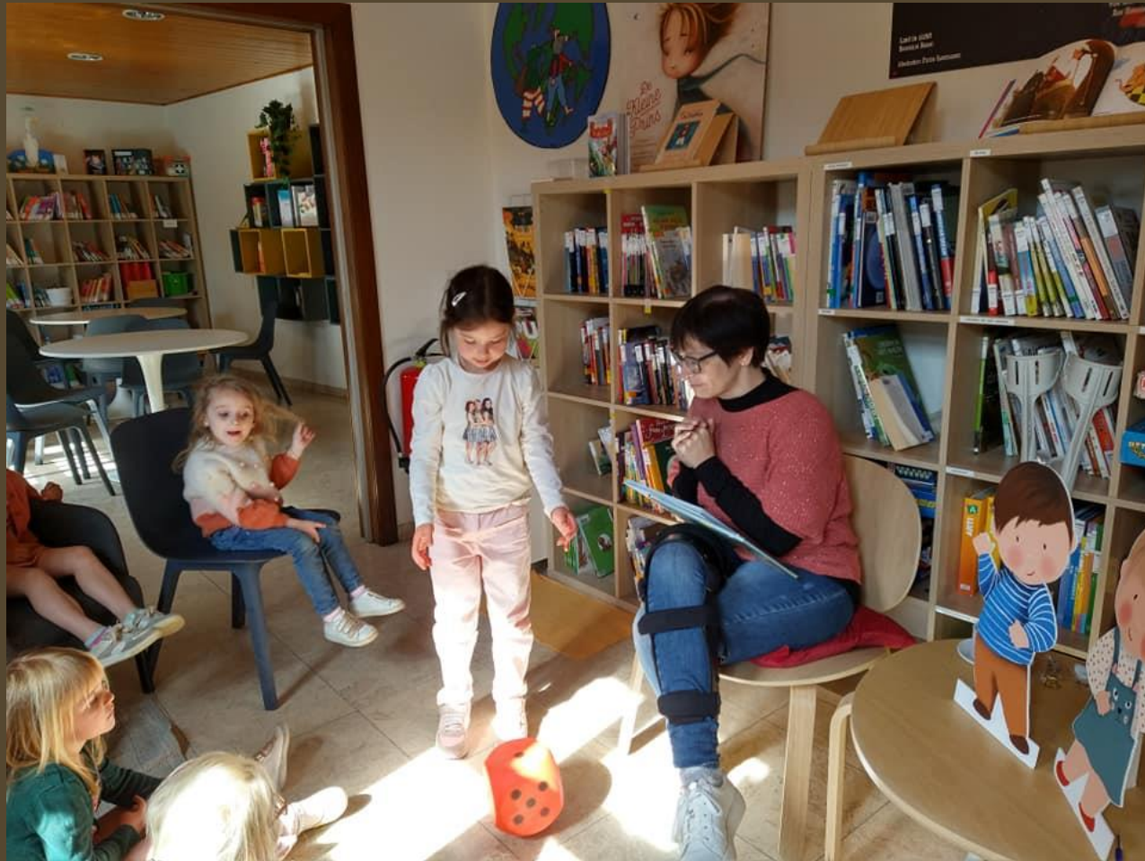
Auteur op bezoek bij de kleuters