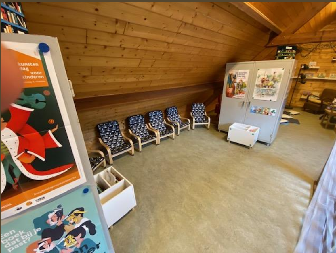
Kleuterhoek met prentenboeken