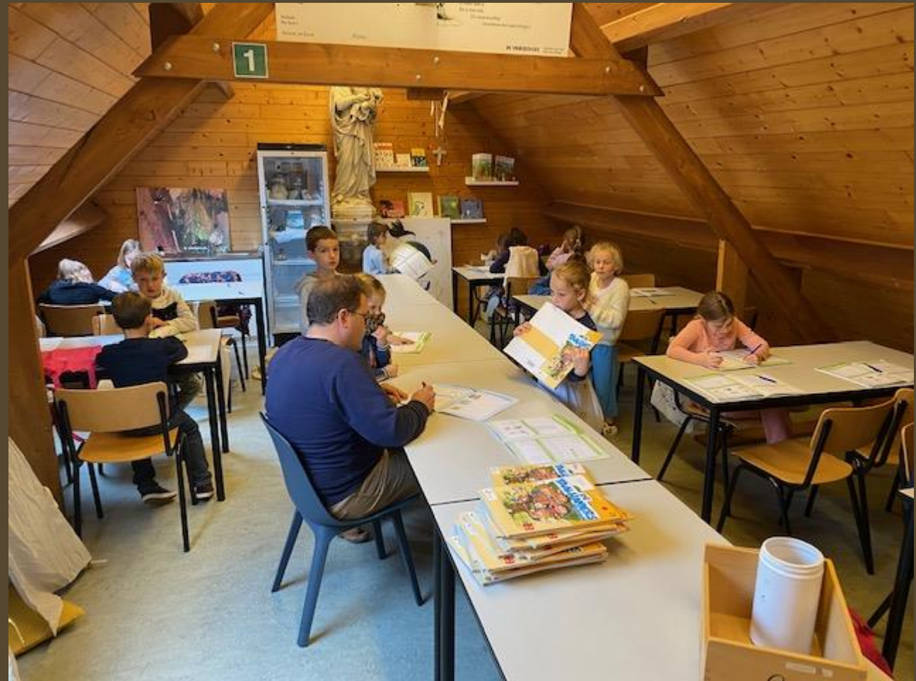
Werkhoekje... Leesmama's, schrijfpodrichtjes