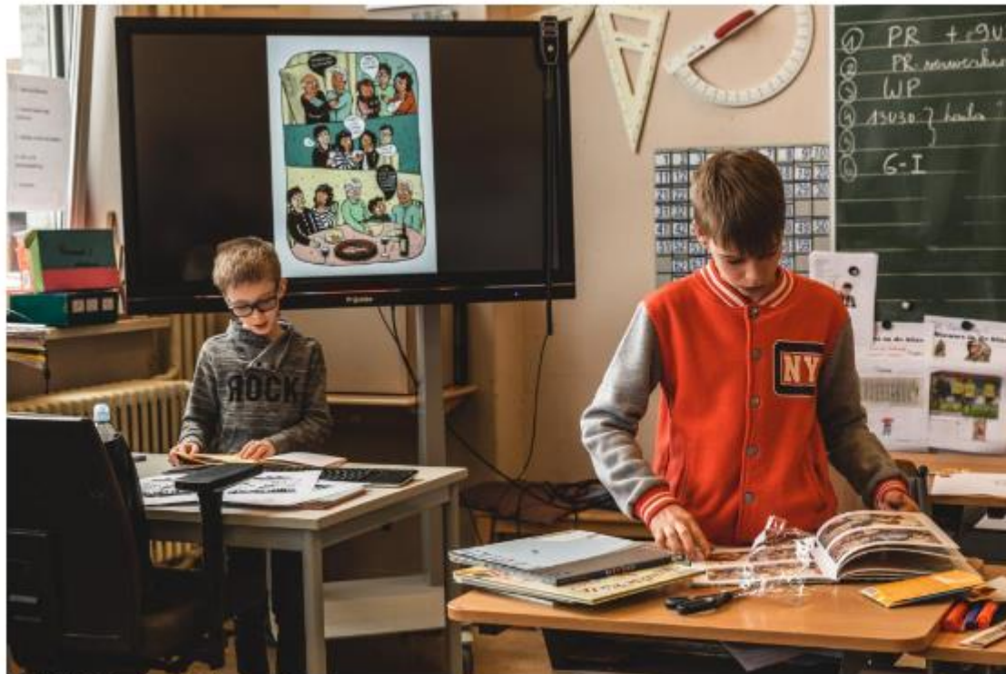
© Michiel Devijver | Iedereen Leest