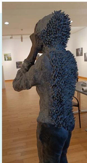
Expo te Mol © Hanne Jacobs