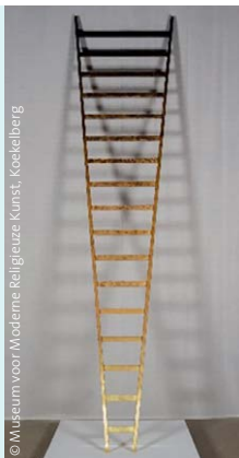
© Museum voor Moderne Kunst, Koekelberg

Deze ladder van Fabrice Samyn staat in het MMRK te Koekelberg.