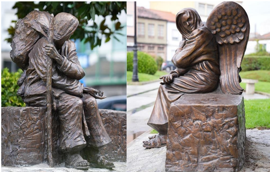
Beeld van Timothy Schmalz.