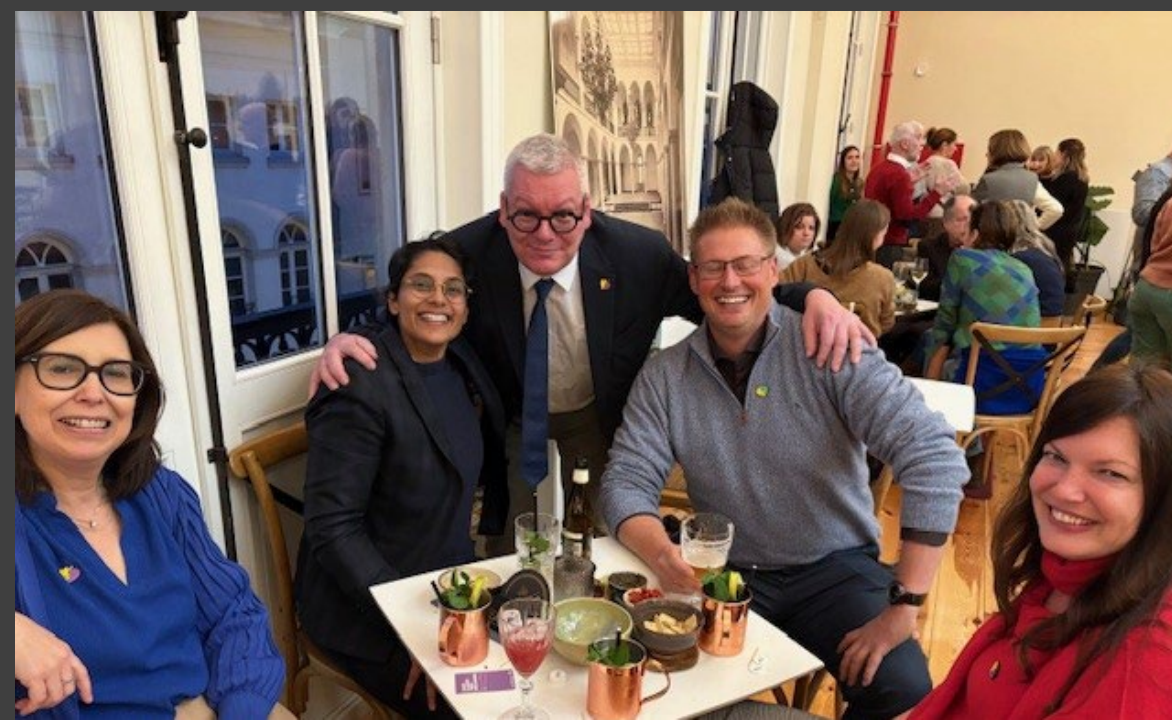
Advents- en sintdrink 06/12/2024