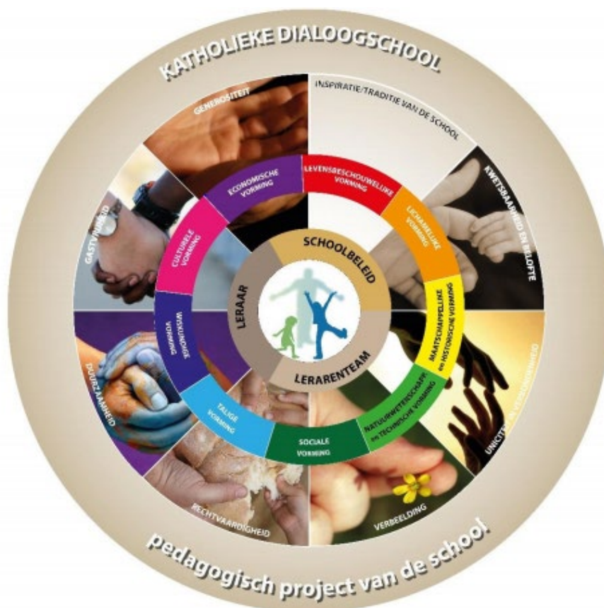
Figuur 1: Wegwijzers voor schoolbeleid

Waarom zou je voor zorgbreed en kansrijk onderwijs gaan? Zit het in het DNA van je school? Als dat zo is, hoe komt dat dan? Of is het eerder je persoonlijke ‘drive’ die je motiveert om er elke dag voor te gaan? Om je te helpen die moeilijke vragen te beantwoorden, creëerden we voor jou acht wegwijzers. Ze zijn bedoeld als inspiratiebron voor jou en je collega’s en hebben sterke raakpunten met de Bijbel en de Bijbelse ‘drive’ om voor goed onderwijs te zorgen.