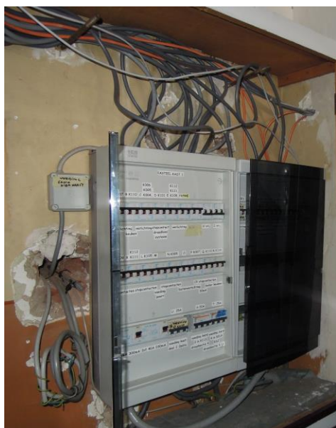
Een schakelkast in de campus Waaiberg van VIA Tienen.