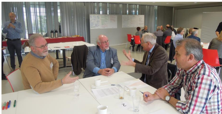
Foto genomen tijdens de Denkdag die een tiental schoolbesturen uit de regio Mechelen hebben georganiseerd op 22 oktober 2016.

is de bedoeling om weldra met gemengde werkgroepen (bestuurders en directeurs) te starten om een en ander verder uit te werken.