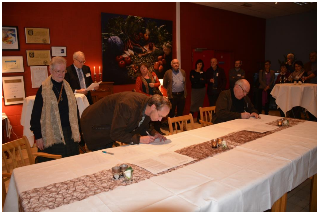
Foto van bij de ondertekening van de Intentieovereenkomst tussen 29 schoolbesturen van de regio Leuven op 11 januari 2016.

In de regio Leuven-Hageland dienen er half februari 2017 knopen te worden doorgehakt, maar is nu al duidelijk dat er een vrij grote groep besturen naar een integraal fusieconcept wil. Een werkgroep van directeurs basis- en secundair onderwijs heeft daar een prachtige blauwdruk uit-