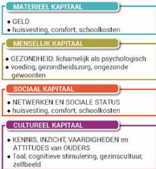
Figuur 1 ontleend aan 'Oog voor meer gelijke onderwijskansen', VLOR, 2008, Brussel

Armoede, in het bijzonder kansarmoede, is dus veel meer dan een leven met een tekort aan middelen en geld. Armoede kun je omschrijven als een ongelijke verdeling van vier soorten kapitaal onder de bevolking: menselijk, materieel, sociaal en cultureel (Nicaise I. en Desmet E., 2008).