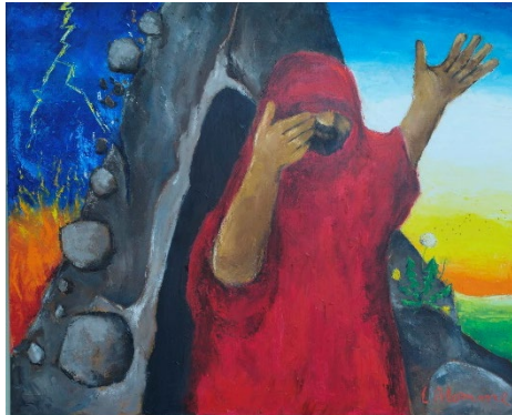
L. Blomme. Pastoraal Centrum, Mechelen

Eerst kwam er een zeer zware storm die bergen deed splijten en rotsen verbrijzelen. Maar God was niet in de storm. Daarna was er een aardbeving. Maar ook in de aardbeving was God niet. Op de aardbeving volgde de bliksem. Maar ook in de bliksem was God niet. Op de bliksem volgde het suizen van een zachte bries. Als Elia dat hoorde, bedekte hij zijn gezicht met zijn mantel.