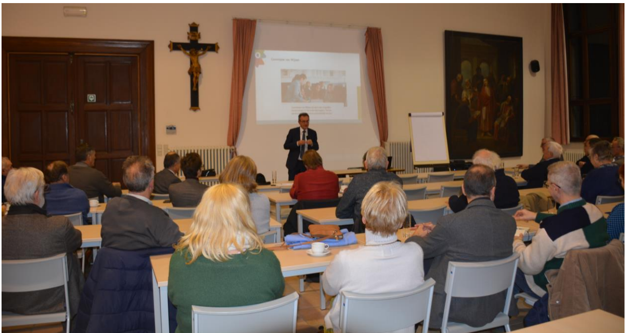
De jaarvergadering van 13 december 2022.