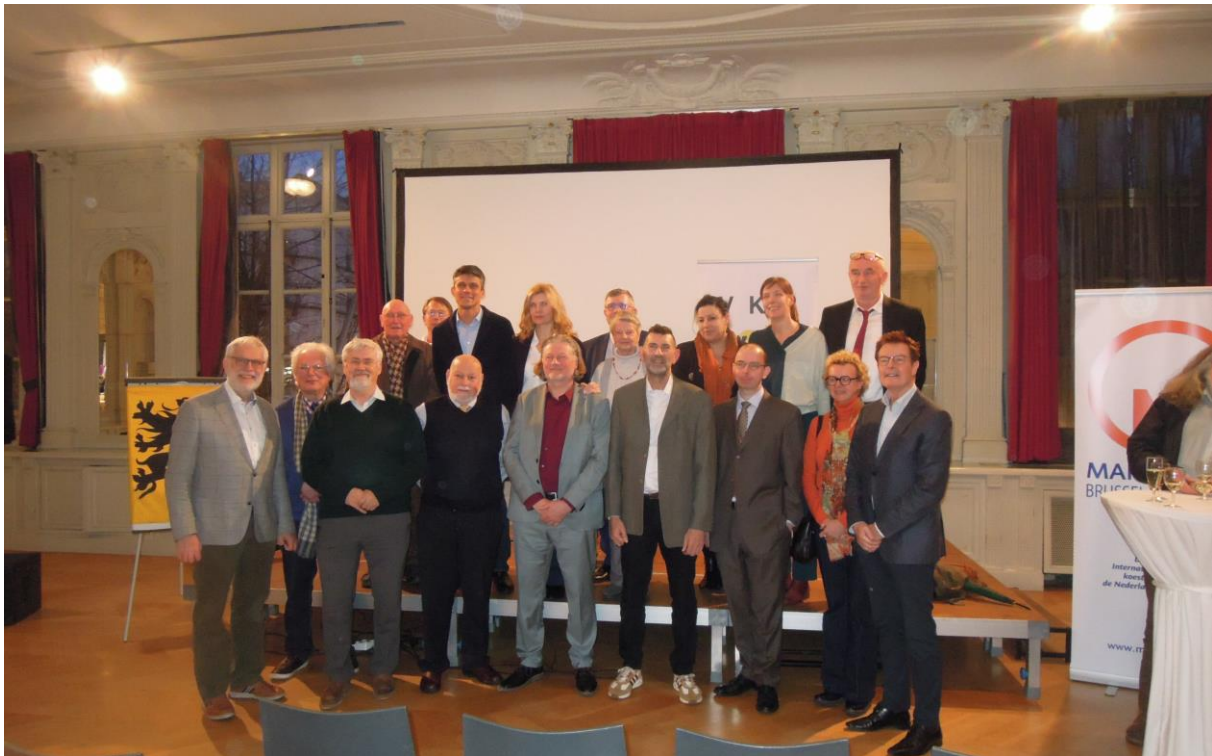
Het Vlaams Komitee voor Brussel met de sprekers en de gelauwerde voor een groepsfoto.