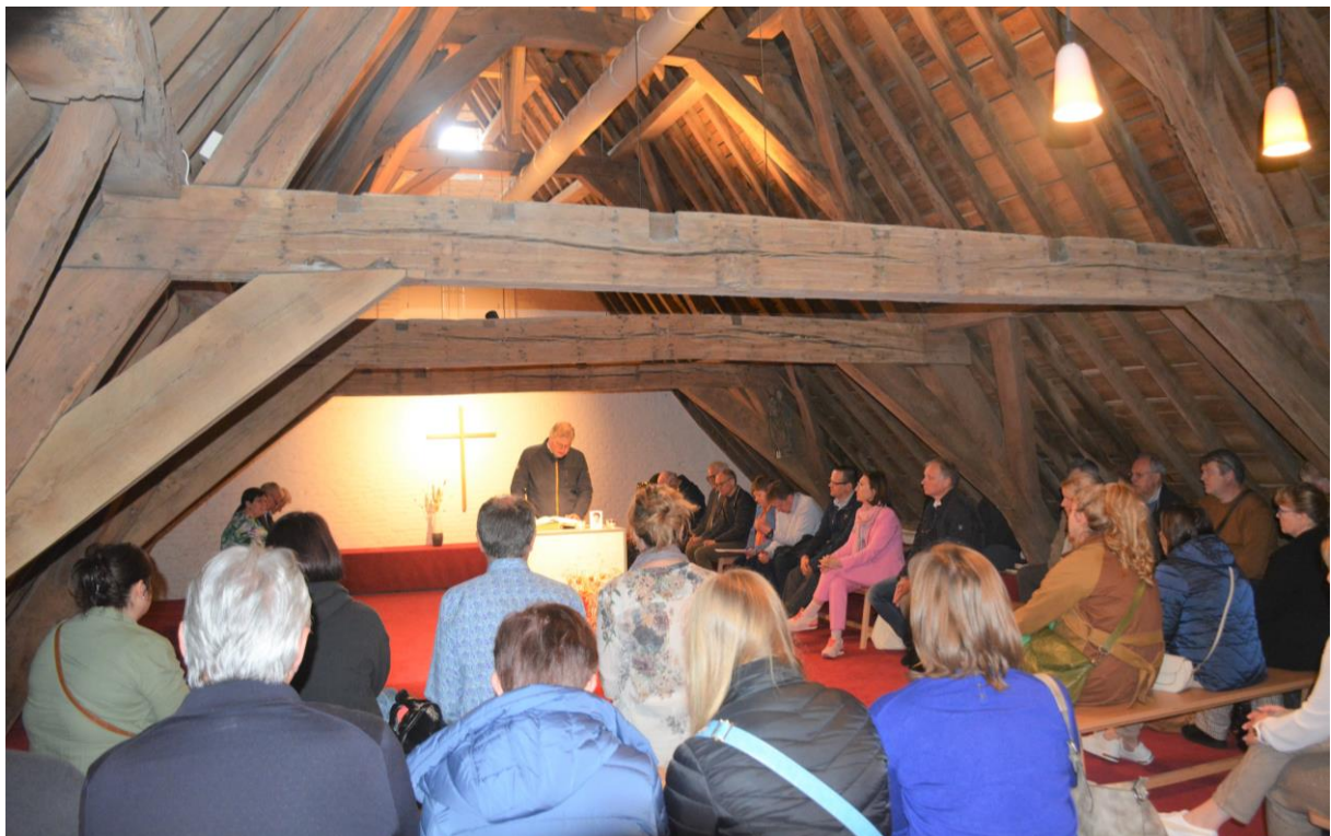
Dag van de vicariale diensten in Gent: bezinning in de stille ruimte onder het dak van het Sint-Baafshuis.

Vorig jaar werd de traditie in het leven geroepen om jaarlijks de medewerkers van de vicariale diensten in één van de vijf bisdommen bij elkaar te brengen voor ontmoeting, uitwisseling en een cultureel-ontspannend programma. Na Brugge in 2022 was het op 2 mei 2023 de beurt aan het bisdom Gent om voor een vijftigtal vicariaatsmedewerkers zo'n 'dag van de vicariale diensten' te organiseren.