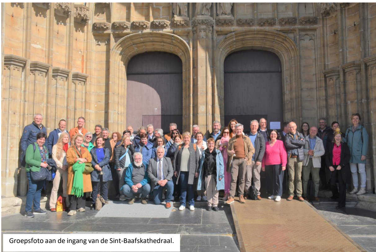
Groepsfoto aan de ingang van de Sint-Baafskathedraal.

Na de maaltijd deelden we ons op in drie verschillende groepen volgens wat we als namiddagactiviteit gekozen hadden: bezoek aan de schatten van het bisschopshuis, rondleiding in het historisch centrum van Gent of 3D-kennismaking met het ontstaan van het kunstwerk van de gebroeders van Eyck, het Lam Gods. Wij hadden voor het laatste gekozen en werden via de tuin van het bisschopshuis in de mooie crypte van de Sint-Baafskathedraal geleid. Daar kregen we een 3D-uitrusting op ons hoofd, waarmee we een virtueel bezoek konden brengen aan onder andere het atelier van de schilders Van Eyck en meer inzicht kregen in het ontstaan van hun meesterwerk. Het veelluik zelf kregen we helaas niet te zien omdat de kathedraal omwille van de veiligheidsmaatregelen rond de verhuizing van de panelen gesloten bleef. De rondleiding met een 3D-bril had wel meer dan ooit onze nieuwsgierigheid geprikkeld om over enkele jaren nog eens terug te keren om het Lam Gods in al zijn pracht te bewonderen.