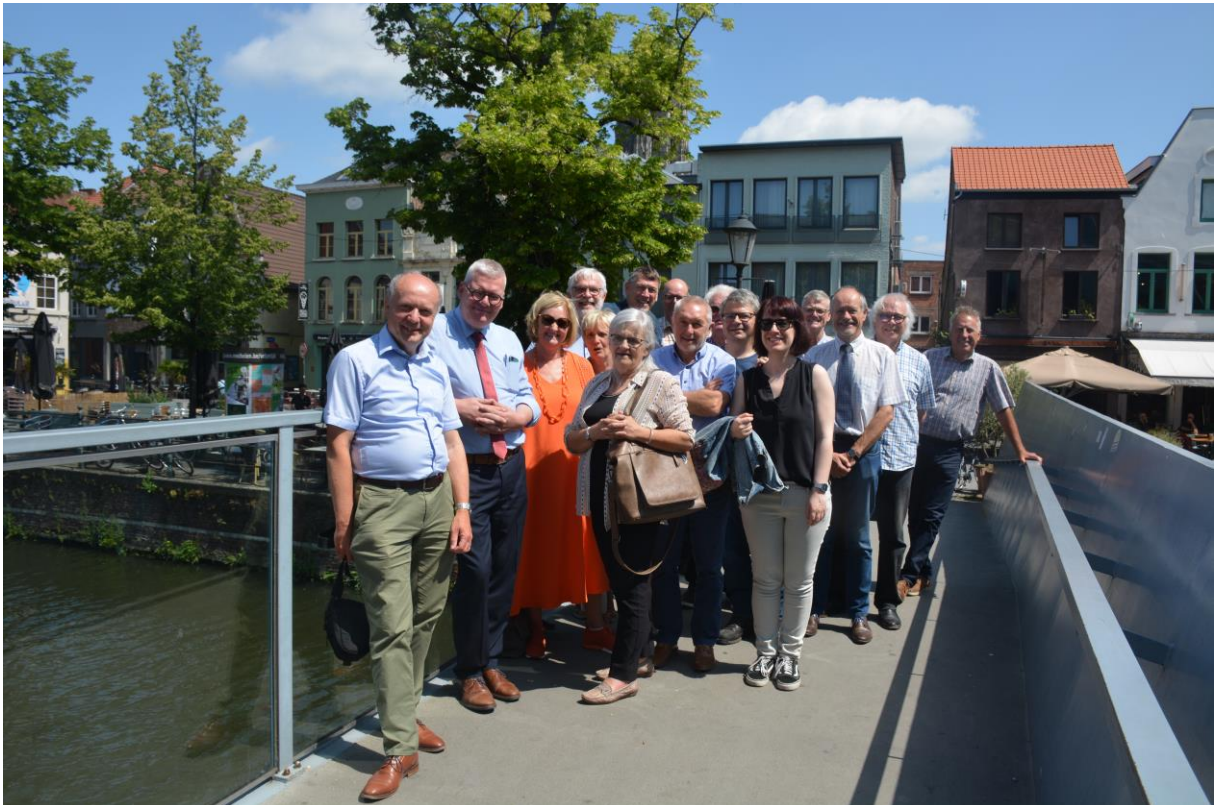
Het Comité Besturen Mechelen-Brussel op een brug aan de Lamotsite na afloop van de laatste vergadering van het schooljaar (foto genomen door toevallige voorbijganger).