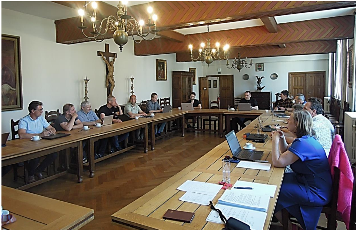
De stuurgroep Preventieadviseurs tijdens de vergadering van 6 juni 2023 in de Merodezaal van het DPC Mechelen.

Voor de daarop volgende terugkomdag, gepland op 14 of 19 maart 2024, zochten de leden naar een thema dat te combineren viel met een 'zandbakoefening', dat is het naspelen van een crisissituatie in een school. De ideeën die daarrond gedeeld werden zullen verder uitgewerkt worden op de volgende vergadering van de stuurgroep, gepland op dinsdag 10 oktober 2023 om 13.30 uur in het Diocesaan Pastoraal Centrum te Mechelen.