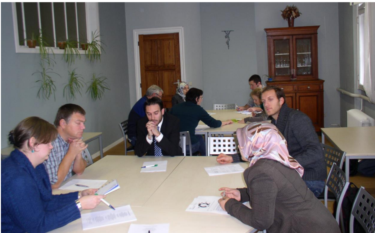
Interreligieuze ontmoeting tussen leraren Rooms-katholieke godsdienst en Islam in Brussel in 2010.

In het huidige (hernieuwde) debat werd inderdaad nooit de stem van de andere levensbeschouwingen binnengelaten. Is dat wel de correcte aanpak in het licht van de katholieke dialogeschool'?