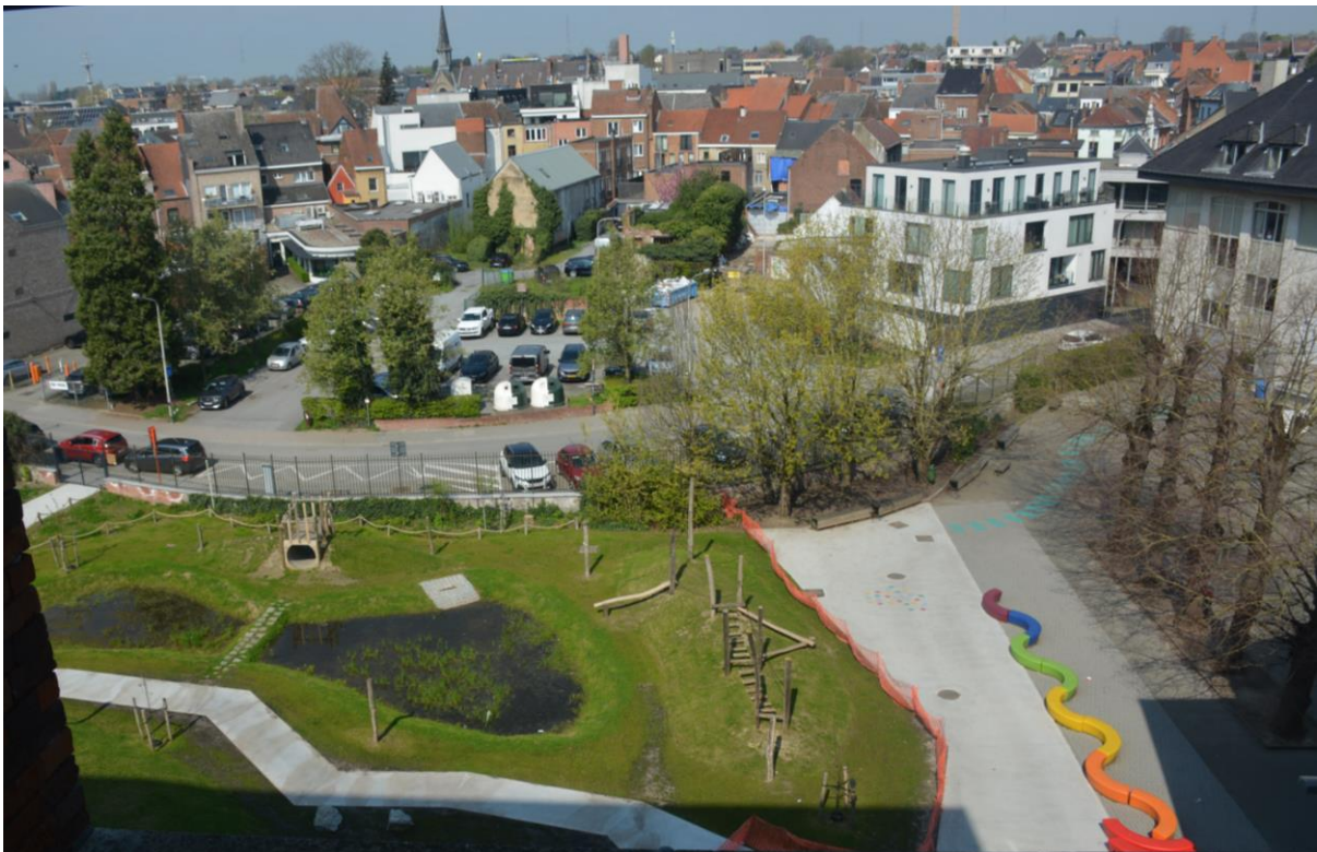
Een groot groen speelveld met wadi's in Heilig-Hart & College Halle