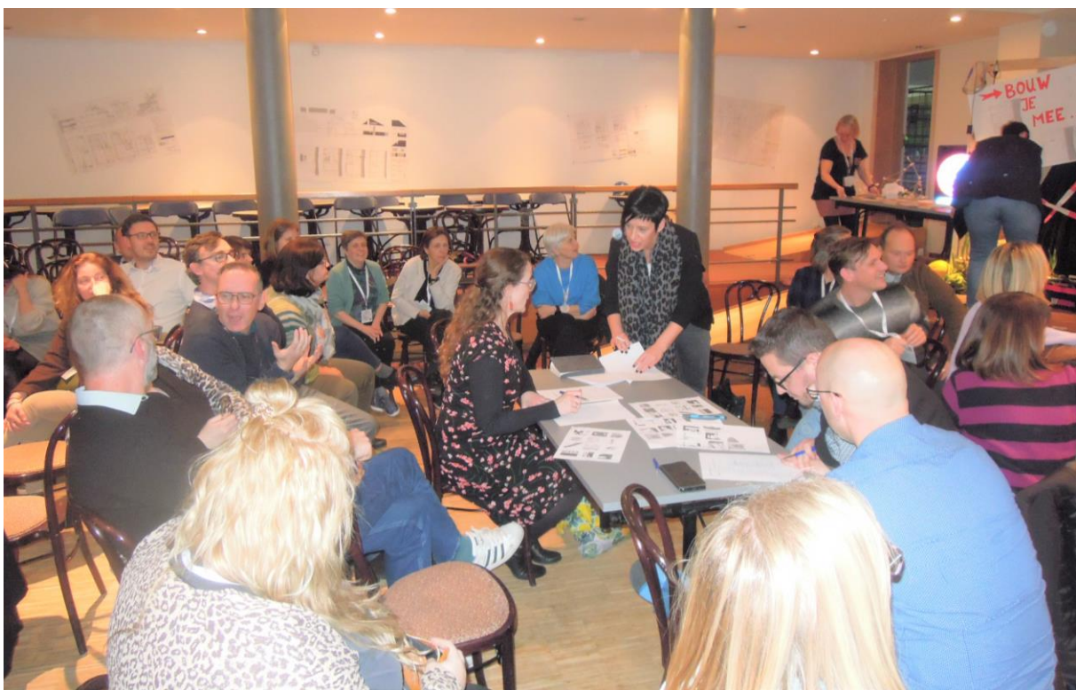
De groep directeurs buitengewoon onderwijs van Mechelen-Brussel tijdens het Colloquium BuO van 1 tot 3 maart 2023.