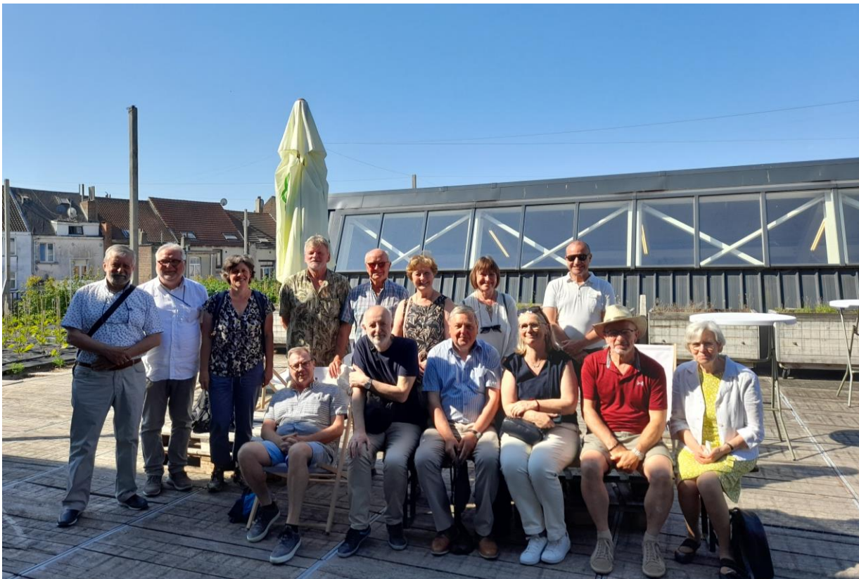
Ingezonden foto van de groep erebegeleiders.

Op de Foodmet vind je alle voeding uit de wereld onder één dak. Je waant je er op de populaire markten van het zuiden van Europa. Dit is meer dan een markt. Hier leeft Brussel met zijn eigen, unieke, levendige sfeer.