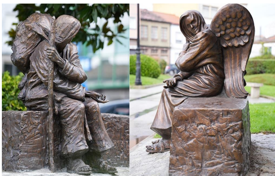
Beeld van Timothy Schmalz.