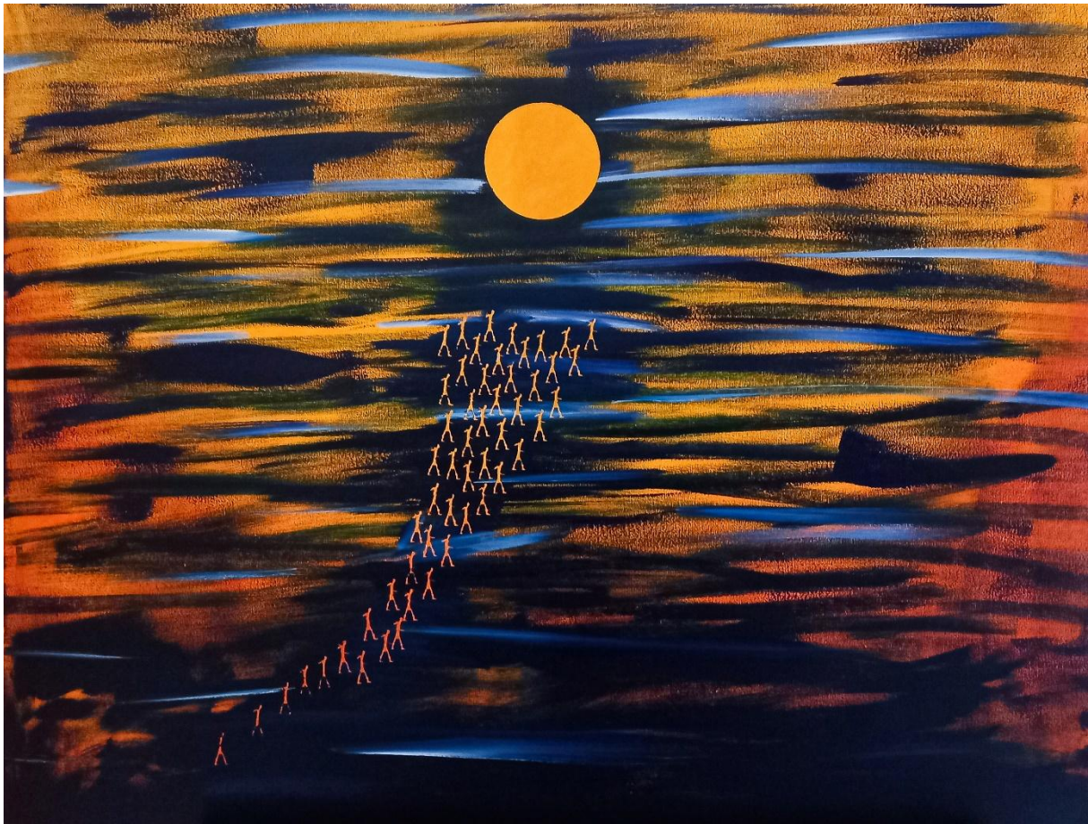
Leeftocht - juni 2025