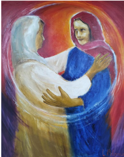
In de kijker rond advent