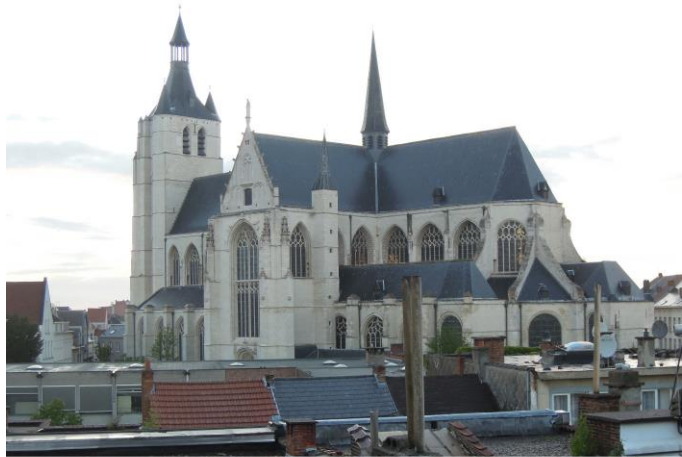
De Onze-Lieve-Vrouw-over-de-Dijle-kerk Mechelen