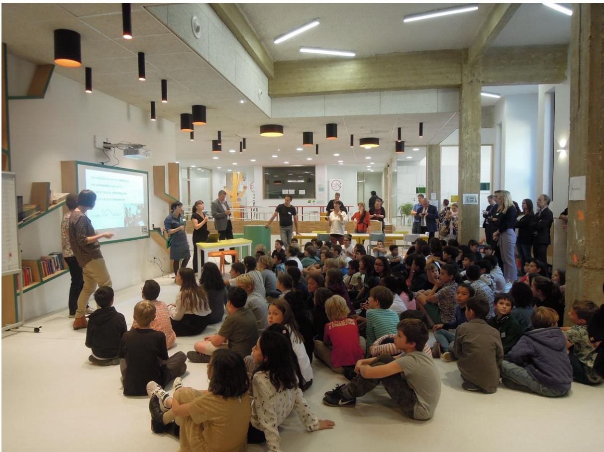
Bij de opening van de eerste Tienschool in Anderlecht op 5 oktober 2018

Ik hou heel erg van de kerstdagen. Het samen feest vieren zullen we dit jaar moeten missen en dat is erg want het gebeurt niet zo vaak dat we met mijn ouders en alle kinderen, schoonkinderen en kleinkinderen samenzijn. Je beseft meteen weer hoe je sommige dingen voor te vanzelfsprekend neemt. Maar het kerstgevoel, die verbondenheid, die donkere sfeer die hoop geeft op betere tijden ... dat blijf ik sowieso allemaal koesteren.