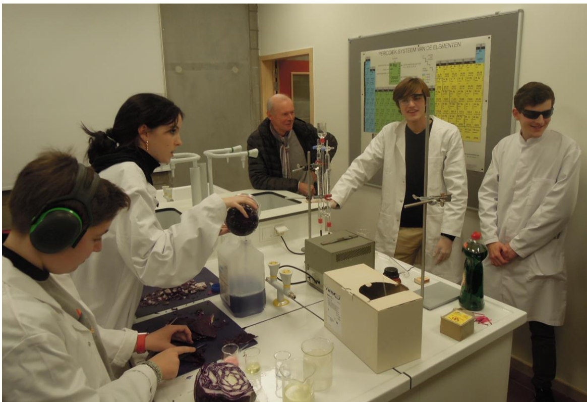
Leerlingen van Ursulinen Mechelen met een demonstratie in het gloednieuwe wetenschapslokaal van het nieuwe schoolgebouw dat geopend werd op 15 november 2019.

Op de vraag naar mogelijke remedies hadden de Cobesleden enkele suggesties: