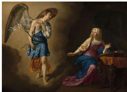
De verkondiging aan Maria van de Velde, Adriaen 1667

Ben ik meer dan alleen de som van elke hoogte en laagte Herinner mij er opnieuw aan wie ik ben want ik moet het weten