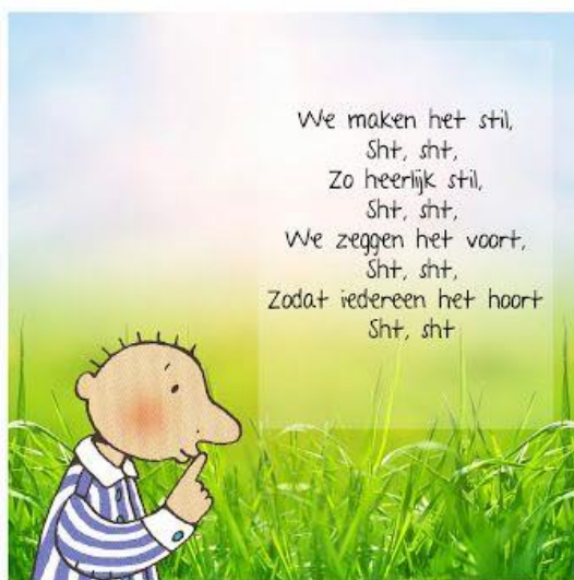
Liedje: "We maken het stil" Om het stil te maken