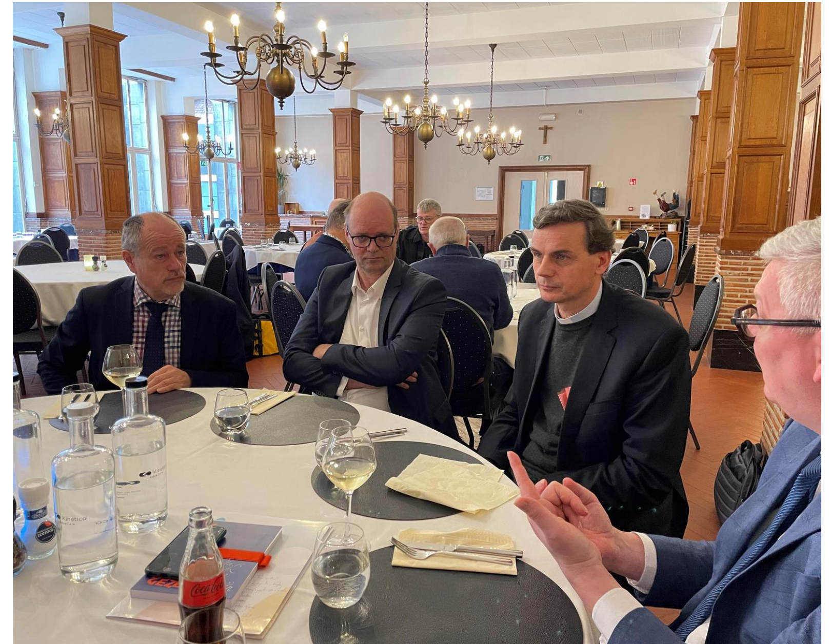
Onze nieuwe aartsbisschop werd uitgenodigd voor een lunch nadien.