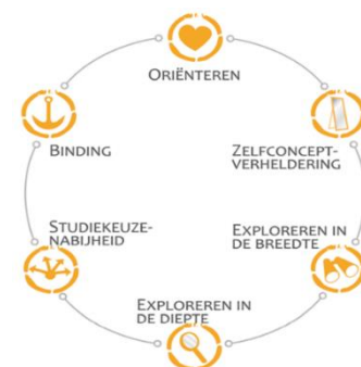
Figuur 1: Besliskundig model - keuzetaken (Germeijs - Verschueren)

Hoe beter de leerling de studiekeuzetaken uitvoert, hoe groter de kans dat hij een onderbouwde keuze maakt voor een duale of niet-duale opleiding.