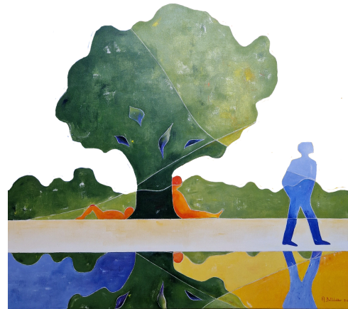
Kunst op de cover – editie januari

Geloof, hoop en liefde vormen samen de kern van de christelijke inspiratie. In deze jaargang staat de liefde centraal : liefde die niet bij woorden blijft, maar concreet werkzaam wordt in barmhartigheid.