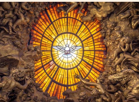
Heilige Geest, Throne Bernini, Sint-Pietersbasiliek, Rome